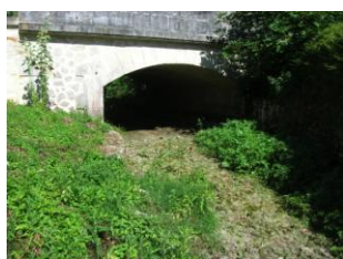
Assec sur la Nie

Parmi les facteurs aggravants de ces inondations, on peut citer l'artificialisation et l'imperméabilisation des sols, mais aussi la perte de la capacités des terrains agricoles à absorber l'eau : compactage des sols, manque d'humus, diminution des vers de terre qui contribuent grandement à la porosité des sols, disparition des haies..., accentuent le ruissellement et diminuent l'absorption de l'eau. Par exemple, un sol vivant et riche en matière organique peut absorber 40 à 100 mm d'eau par heure. Un sol cultivé en conventionnel absorbe en moyenne 10 mm d'eau par heure.