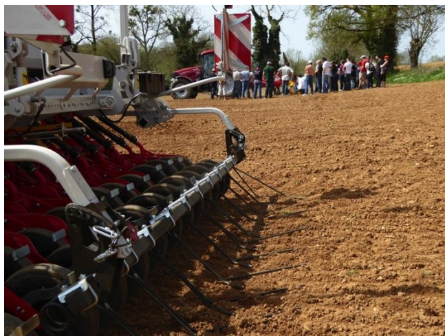
Journée technique du 15 avril 2015 à Saint Marc la Lande

ne sont que quelques-unes des actions menées lors de ces 5 années : le programme s'est vu large et ambitieux. Un bilan encourageant a été réalisé sur ce premier programme et conclut au réengagement du SMAEP 4B dans un nouveau programme d'actions pour la période 2017-2021.